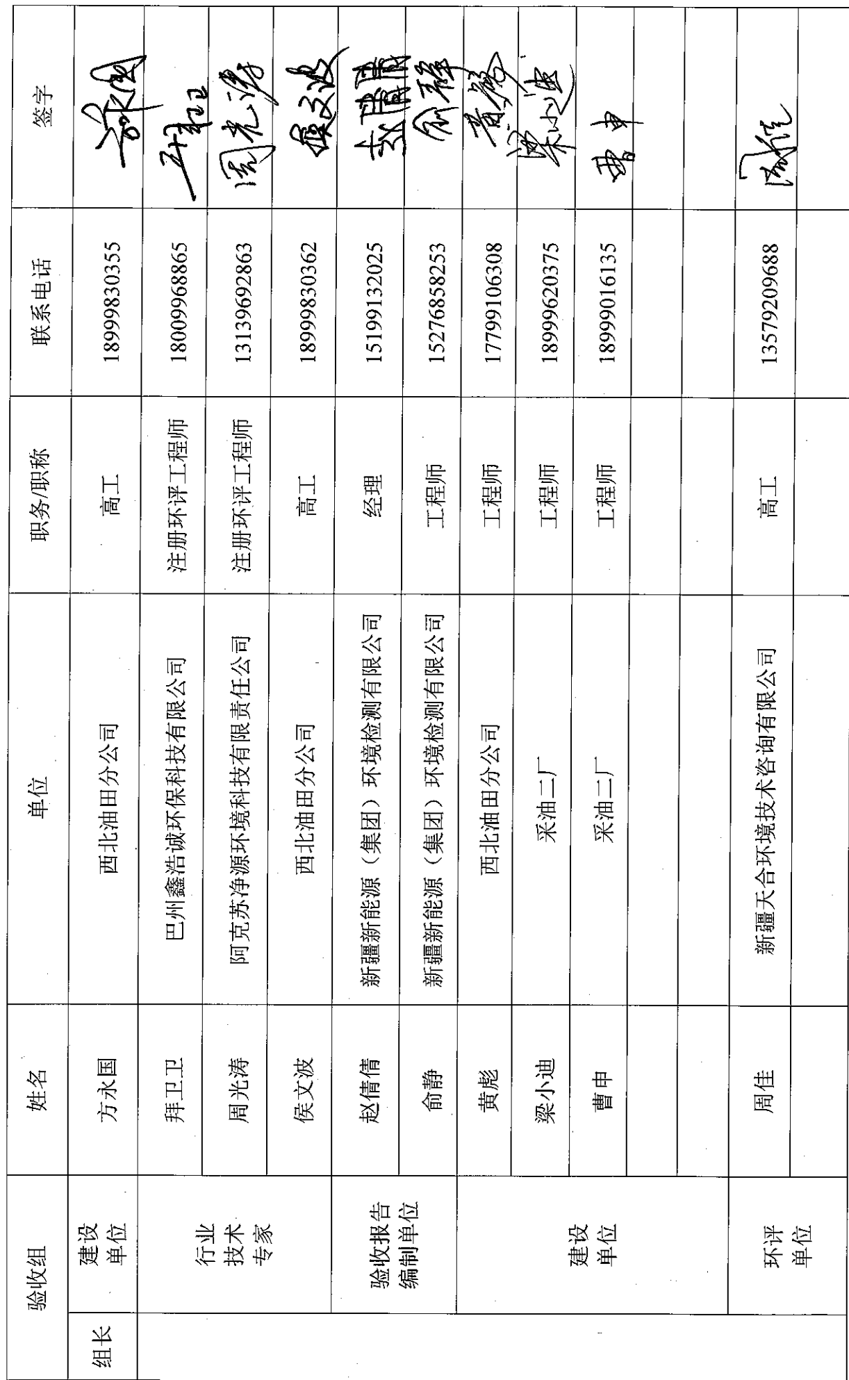
TH12463X 井钻井工程竣工环境保护验收组名单