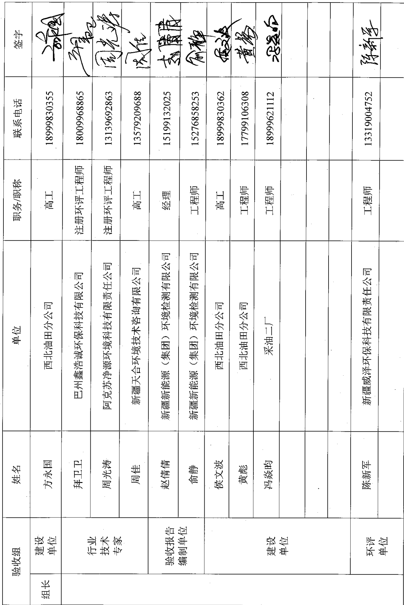
采油三厂 TP197X 管道建设工程竣工环境保护验收组名单